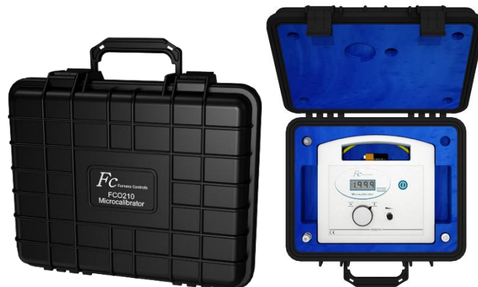
Optional: Wasserdichter Koffer

Furness Controls hat ein UKAS zertifiziertes Labor und bietet Druckkalibrierungen von 0 bis 40 kPa und Durchflusskalibrierungen von 0.1 ml/min bis 2000 Liter/min